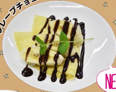
クレープチョコバナナ