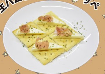
生ハムとチーズのカナッペ