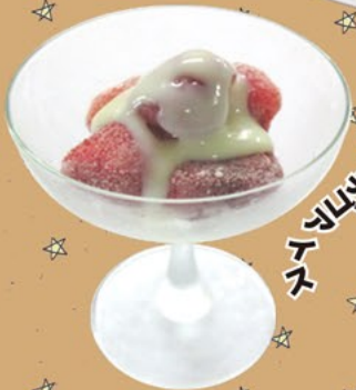
苺ミルクシェイク