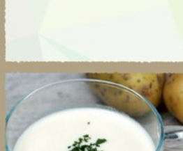
NEW 冷製ジャガイモのビシソワーズ