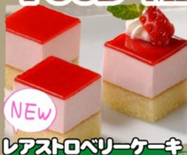
NEW レアストロベリーケーキ