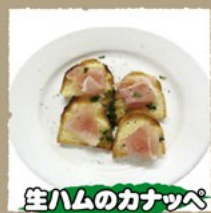
生ハムのカナッペ