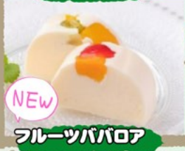
NEW フルーツパバロア