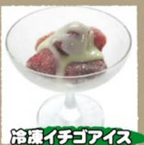
冷凍イチゴアイス